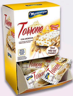
Cód: 1686 Torrone com Amendoim 300g