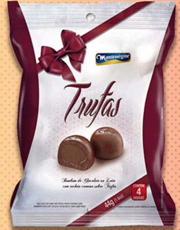
Cód: 2767 Bombom Trufas