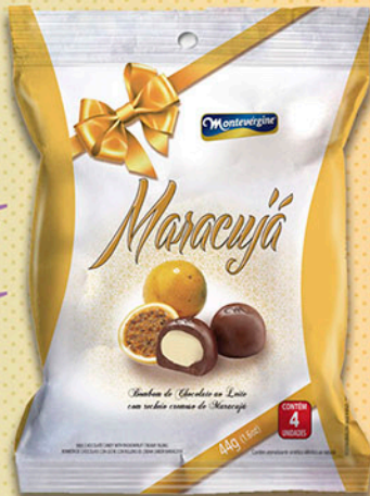
Cód: 2677 Bombom Maracujá