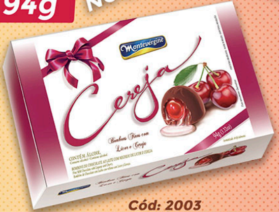
Cód: 2003 Bombom Cereja ao Licor