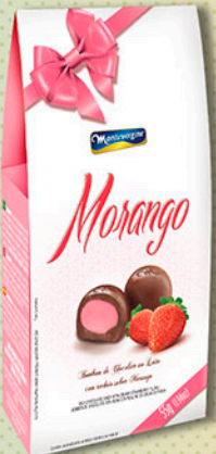
Cód: 2261 Bombom Morango