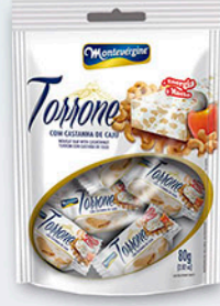
Cód: 1383 Torrone com Castanha de Caju 80g