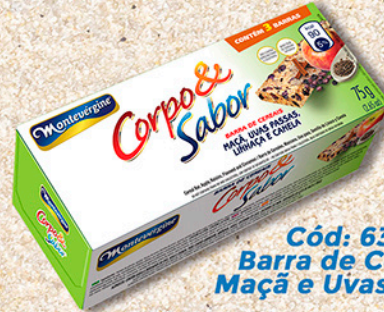
Cód: 6312 Barra de Cereais Maçã e Uvas Passas