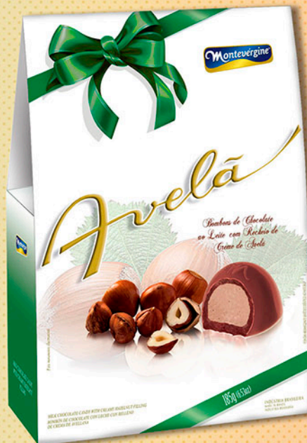
Cód: 2375 Bombom Creme de Avelã 185g