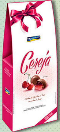
Cód: 2053 Bombom Licor & Cereja Picada