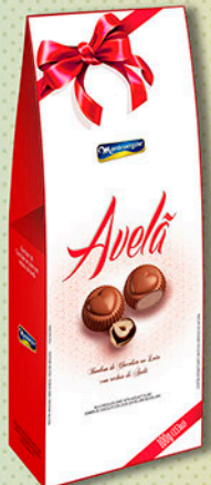
Cód: 2373 Bombom Creme de Avelã