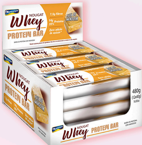
Cód: 5011 MontevérGINE Whey Nougat Protein Bar Pasta de Amendoim