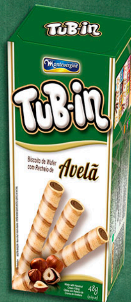
Cód: 4622 Tub-in Avelã - 48g