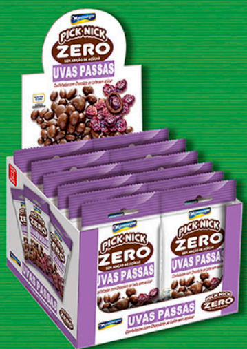
Cód: 3028 Pick Nick Zero Uvas Passas