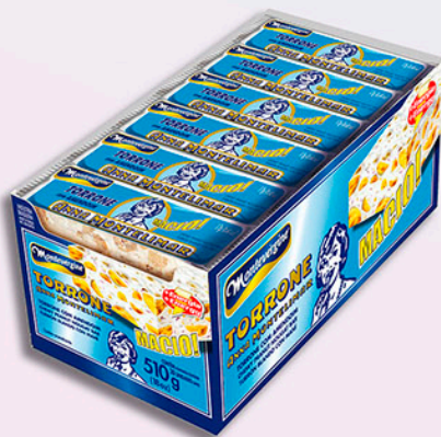
Cód: 1108 Torrone Ana Montelimar com Amendoim 30x17g