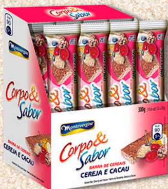
Cód: 6019 Barra de Cereais Cereja & Cacau