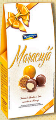
Cód: 2661 Bombom Maracujá