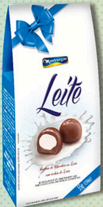
Cód: 2161 Bombom Leite