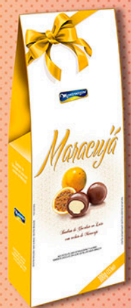
Cód: 2663 Bombom Maracujá