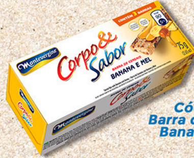
Cód: 6112 Barra de Cereais Banana e Mel