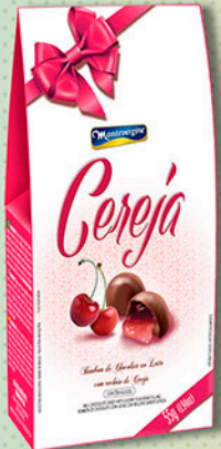
Cód: 2051 Bombom Licor & Cereja Picada