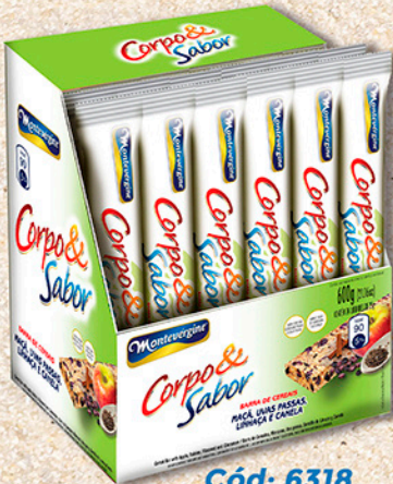
Cód: 6318 Barra de Cereais Maçã e Uvas Passas