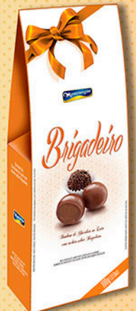
Cód: 2863 Bombom Brigadeiro