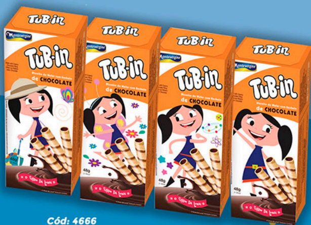
Cód: 4666 Tub-in Chocolate "O Show da Luna!" - 48g