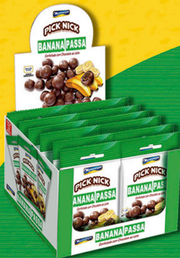
Cód: 3229 Pick Nick Banana Passa