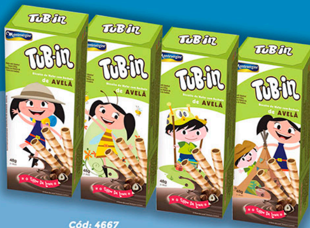
Cód: 4667 Tub-in Avelã "O Show da Luna!" - 48g