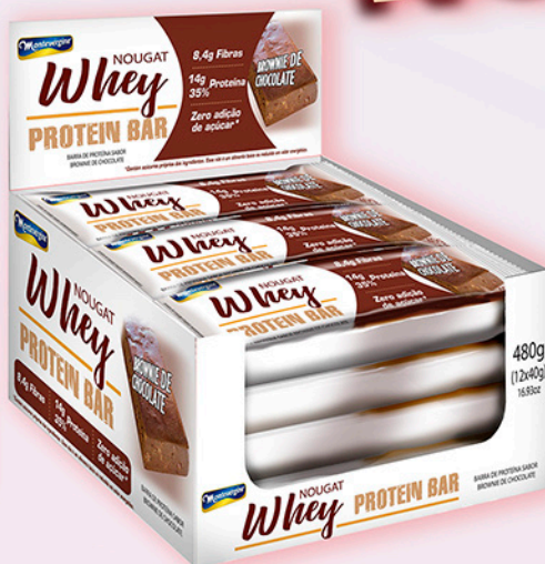
Cód: 5012 MontevérGINE Whey Nougat Protein Bar Brownie de Chocolate