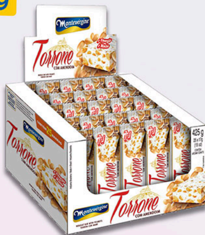
Cód: 1627 Torrone com Amendoim 25x17g