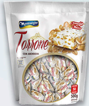
Cód: 1600 Torrone com Amendoim 500g