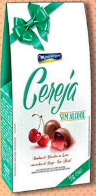
Cód: 2061 Bombom Cereja Picada sem álcool