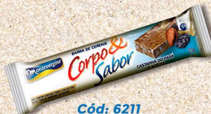
Cód: 6211 Barra de Cereais Castanha do Pará & Ameixa