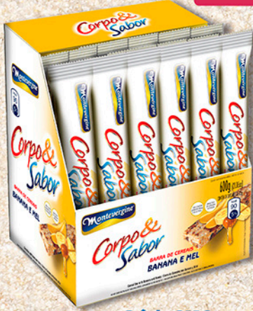
Cód: 6118 Barra de Cereais Banana e Mel