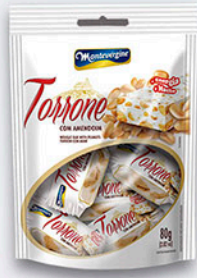
Cód: 1683 Torrone com Amendoim 80g