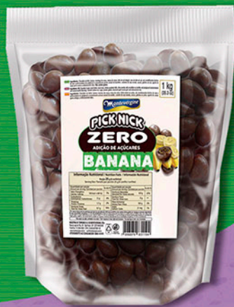
Cód: 3227 Pick Nick Zero Banana Passa