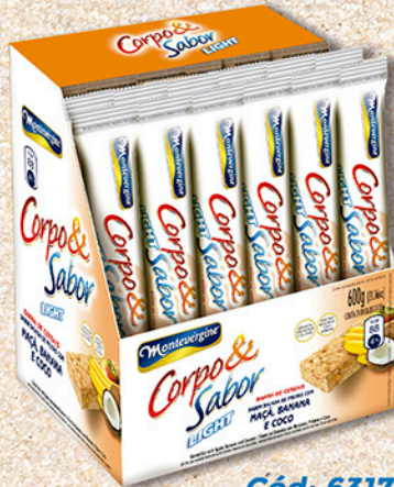
Cód: 6317 Barra de Cereais Salada de Frutas