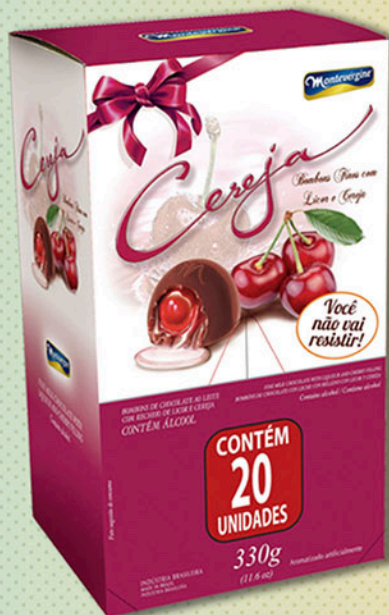
Cód: 2006 Bombom Cereja ao Licor 330g