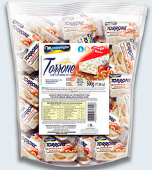
Cód: 1300 Torrone com Castanha de Caju 500g