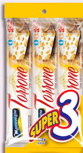
Cód: 1633 Torrone com Amendoim 3x90g