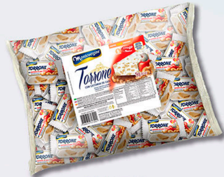
Cód: 1399 Torrone com Castanha de Caju 1kg