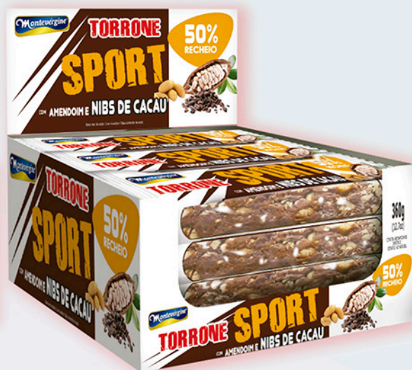
Cód: 1411 Torrone Sport Amendoim & Nibs de Cacau