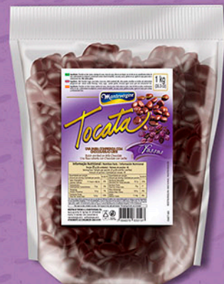
Cód: 3019 Tocata Uvas Passas