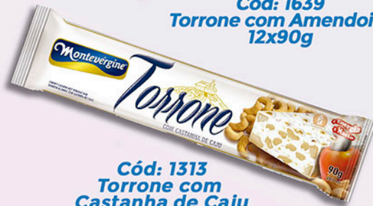
Cód: 1313 Torrone com Castanha de Caju 90g