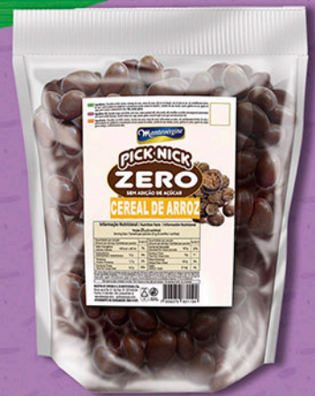
Cód: 3127 Pick Nick Zero Cereal de Arroz