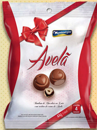
Cód: 2377 Bombom de Creme de Avelã