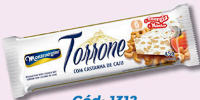
Cód: 1312 Torrone com Castanha de Caju 45g