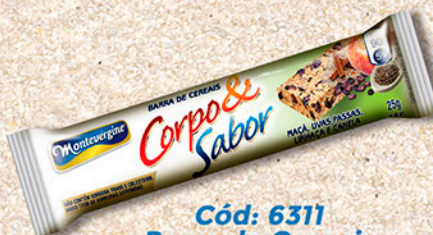
Cód: 6311 Barra de Cereais Maçã & Uvas Passas