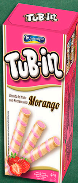
Cód: 4673 Tub-in Morango - 48g