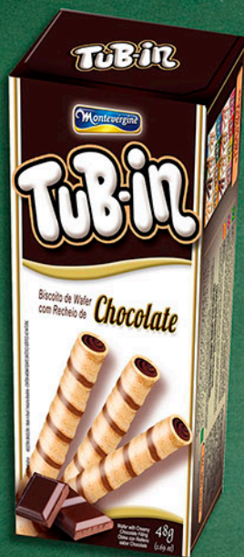
Cód: 4652 Tub-in Chocolate - 48g

A HORA DO RECREIO NUNCA FOI TÃO GOSTOSA !!