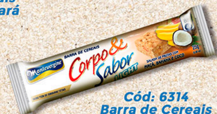
Cód: 6314 Barra de Cereais Salada de Frutas