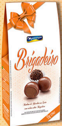
Cód: 2851 Bombom Brigadeiro