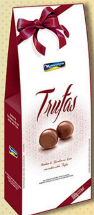
Cód: 2763 Bombom Trufas