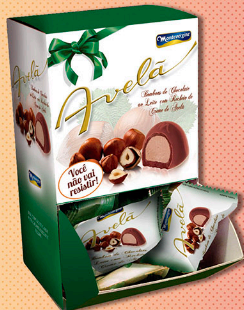
Cód: 2374 Bombom Creme de Avelã 320g