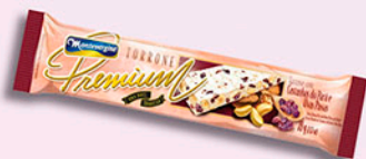
Cód: 1812 Torrone Premium com Castanha do Pará 70g