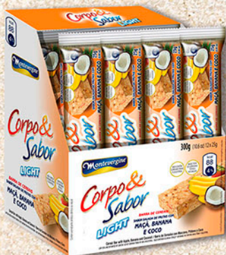
Cód: 6316 Barra de Cereais Salada de Frutas