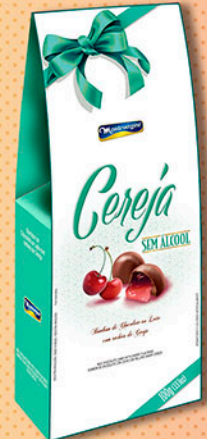
Cód: 2063 Bombom Cereja Picada sem álcool