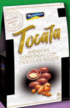
Cód: 2123 Tocata Amêndoas