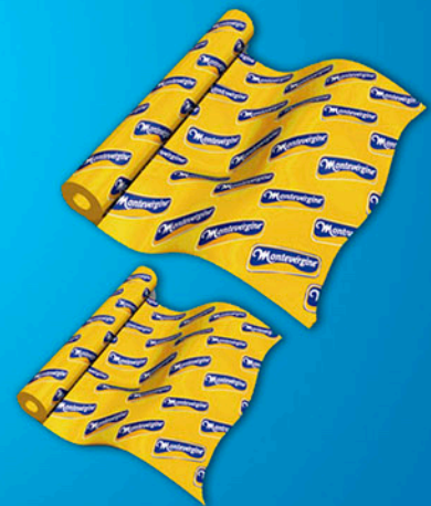
BOBINA DE FORRAÇÃO (LARGURAS: 62cm | 25cm)