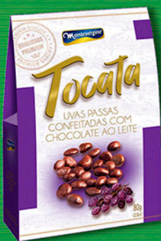
Cód: 3013 Tocata Uvas Passas