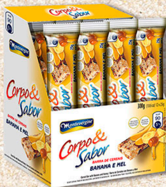
Cód: 6119 Barra de Cereais Banana & Mel