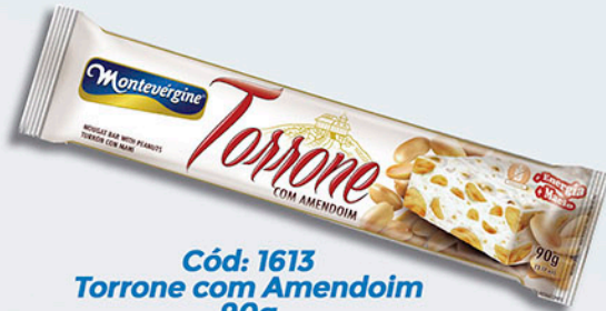
Cód: 1613 Torrone com Amendoim 90g