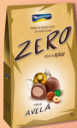
Cód: 2462 Bombom Creme de Avelã Zero Adição de Açúcar 80g