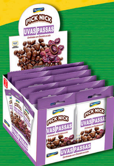
Cód: 3029 Pick Nick Uvas Passas