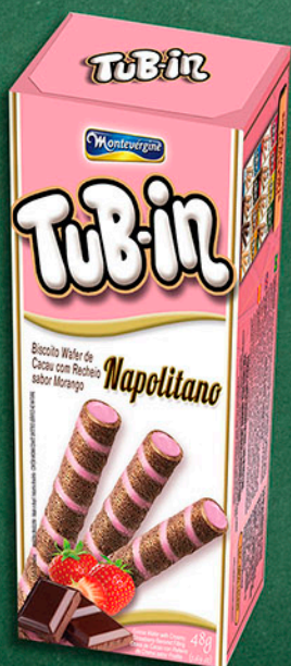
Cód: 4674 Tub-in Napolitano - 48g