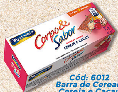
Cód: 6012 Barra de Cereais Cereja e Cacau