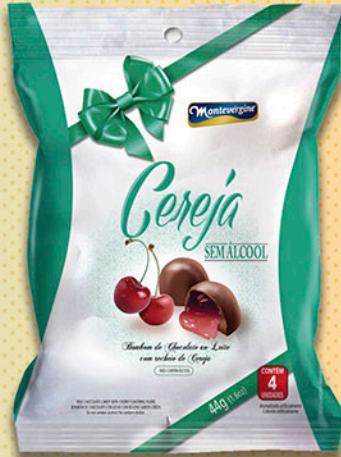
Cód: 2067 Bombom Cereja Picada sem álcool