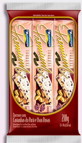
Cód: 1815 Torrone Premium com Castanha do Pará 3x70g