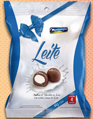
Cód: 2167 Bombom Leite