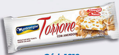
Cód: 1612 Torrone com Amendoim 45g