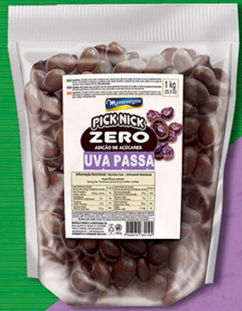
Cód: 3027 Pick Nick Zero Uvas Passas