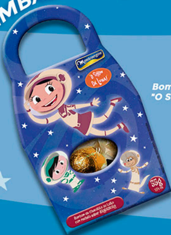
Cód: 7001 Bolsa com Bombons de Brigadeiro "O Show da Luna!" - 55g