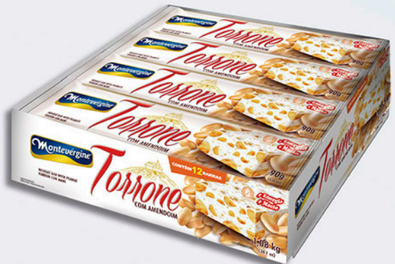
Cód: 1639 Torrone com Amendoim 12x90g