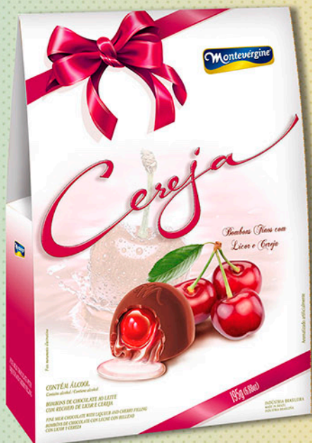
Cód: 2005 Bombom Cereja ao Licor 195g