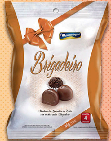
Cód: 2867 Bombom Brigadeiro