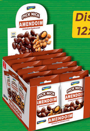
Cód: 3429 Pick Nick Amendoim