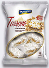
Cód: 1682 Torrone com Amendoim 50g