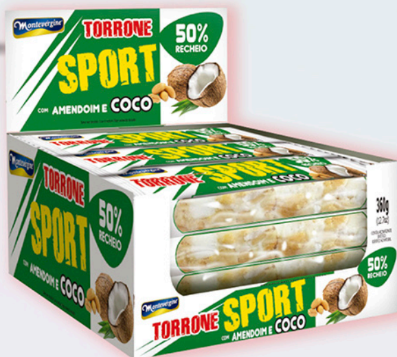
Cód: 1410 Torrone Sport Amendoim & Coco