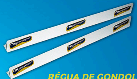
RÉGUA DE GONDOLA (CANTONEIRA)