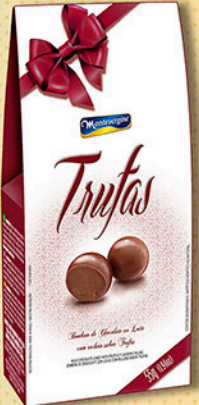
Cód: 2761 Bombom Trufas