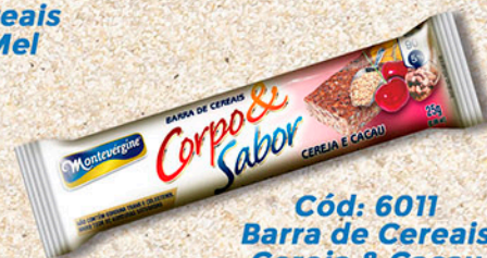
Cód: 6011 Barra de Cereais Cereja & Cacau