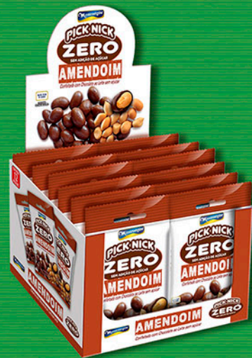
Cód: 3428 Pick Nick Zero Amendoim