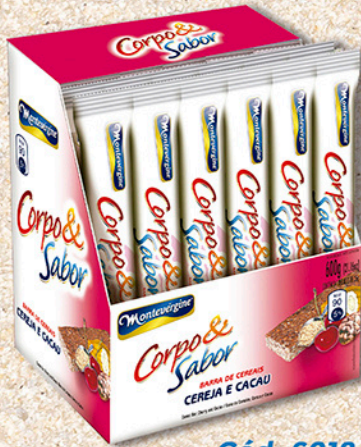
Cód: 6018 Barra de Cereais Cereja e Cacau