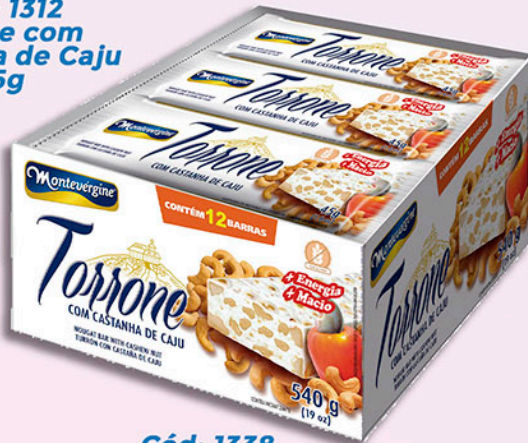
Cód: 1338 Torrone com Castanha de Caju 12x45g