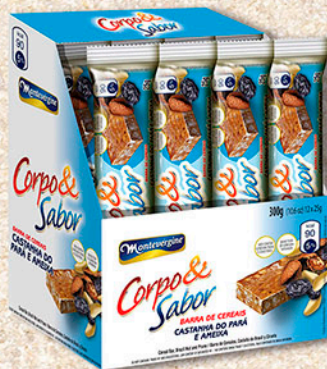
Cód: 6219 Barra de Cereais Castanha do Pará & Ameixa