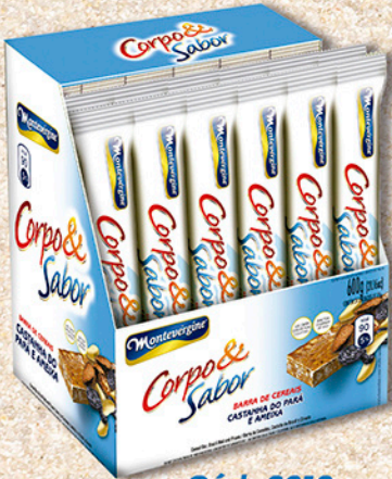
Cód: 6218 Barra de Cereais Castanha do Pará & Ameixa