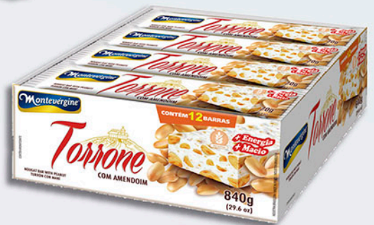
Cód: 1636 Torrone com Amendoim 12x70g