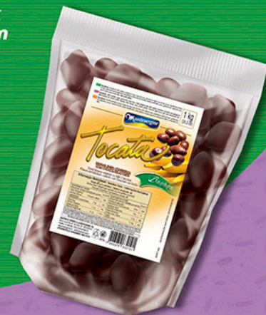
Cód: 3219 Tocata Banana Passa