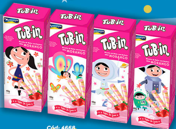
Cód: 4668 Tub-in Morango "O Show da Luna!" - 48g