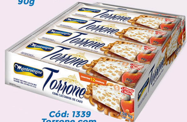
Cód: 1339 Torrone com Castanha de Caju 12x90g