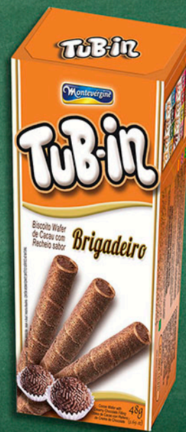
Cód: 4647 Tub-in Brigadeiro - 48g