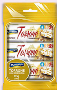
Cód: 1632 Torrone com Amendoim 3x45g