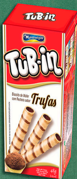
Cód: 4612 Tub-in Trufas - 48g