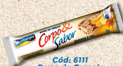
Cód: 6111 Barra de Cereais Banana & Mel