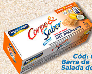
Cód: 6315 Barra de Cereais Salada de Frutas