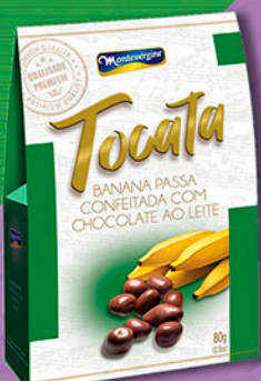
Cód: 3213 Tocata Banana Passa