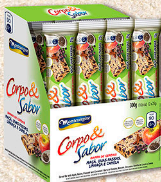
Cód: 6319 Barra de Cereais Maçã & Uvas Passas