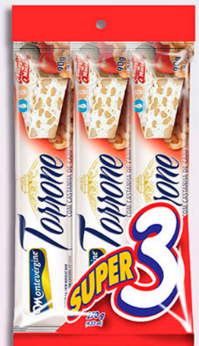
Cód: 1333 Torrone com Castanha de Caju 3x90g