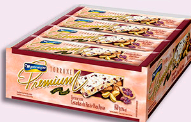
Cód: 1836 Torrone Premium com Castanha do Pará 12x70g