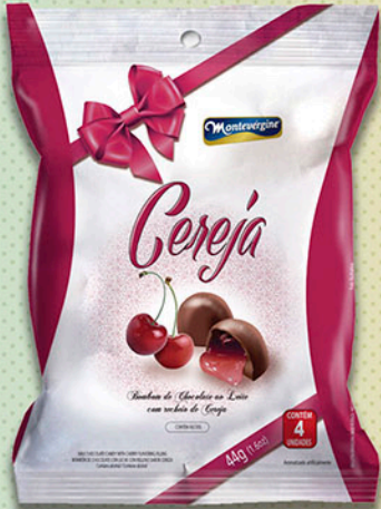
Cód: 2057 Bombom Licor & Cereja Picada