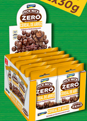
Cód: 3128 Pick Nick Zero Cereal de Arroz