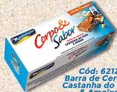
Cód: 6212 Barra de Cereais Castanha do Pará & Ameixa