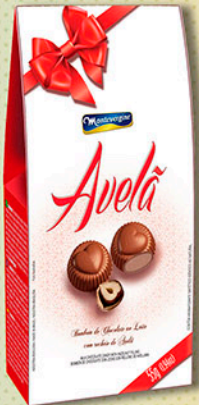
Cód: 2371 Bombom Creme de Avelã