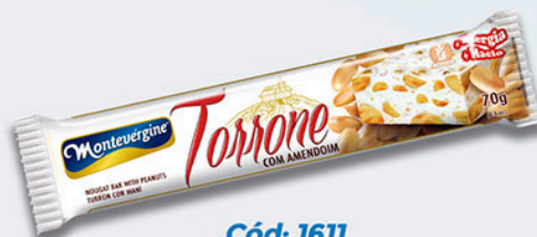
Cód: 1611 Torrone com Amendoim 70g