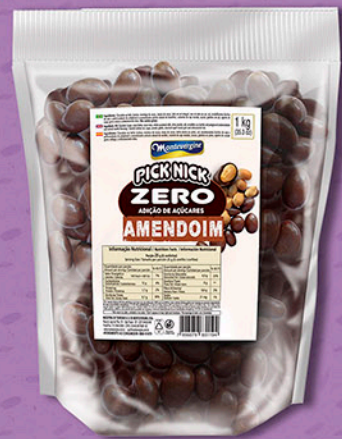
Cód: 3427 Pick Nick Zero Amendoim