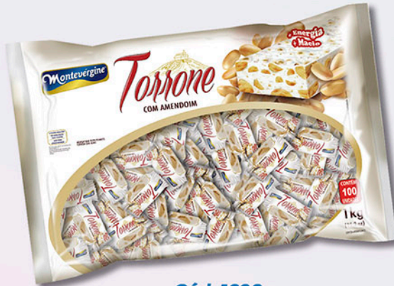
Cód: 1690 Torrone com Amendoim 1kg