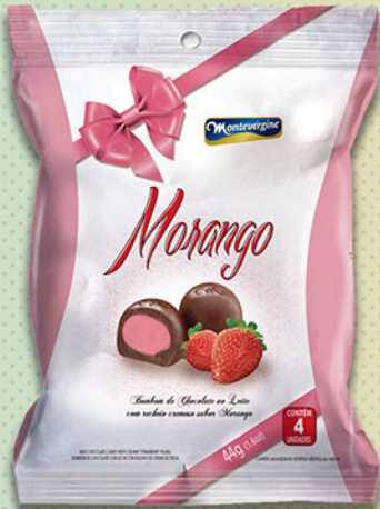
Cód: 2267 Bombom Morango