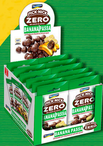
Cód: 3228 Pick Nick Zero Banana Passa