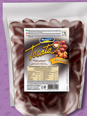
Cód: 2119 Tocata Amêndoas