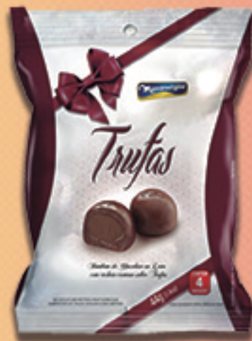
Cód: 2767 Bombom Trufas