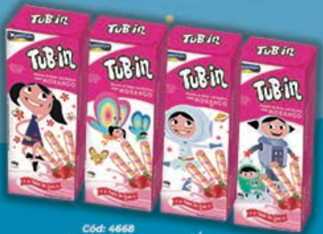
Cód: 4668 Tub-in Morango "O Show da Luna!" - 48g