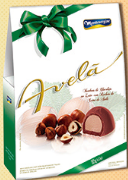
Cód: 2375 Bombom Creme de Avelã 185g