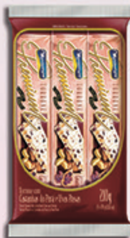
Cód: 1815 Torrone Premium com Castanha do Pará 3x70g