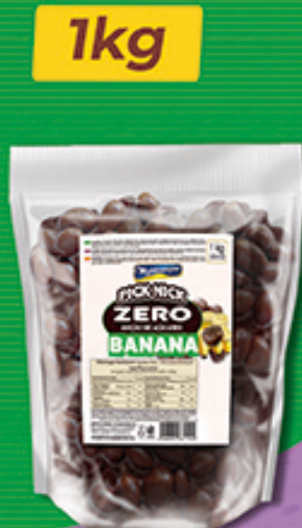
Cód: 3227 Pick Nick Zero Banana Passa