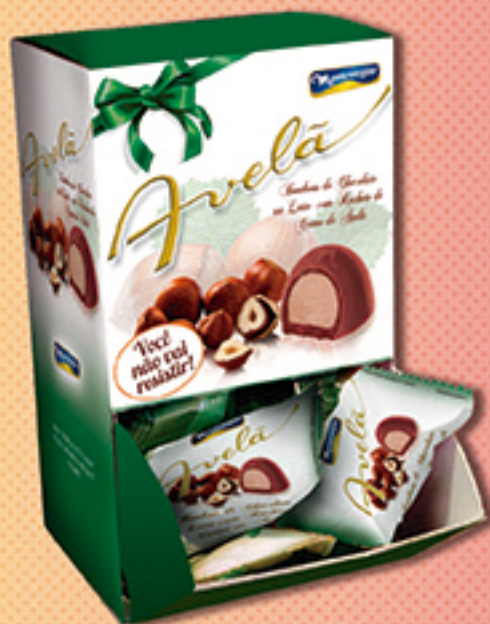
Cód: 2374 Bombom Creme de Avelã 320g