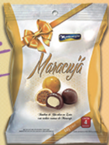
Cód: 2677 Bombom Maracujá