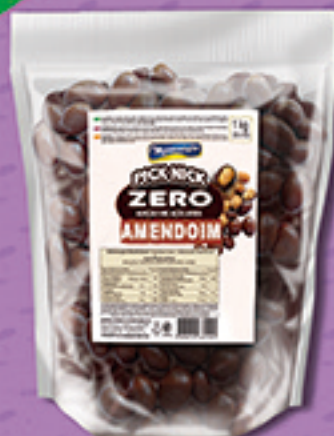
Cód: 3427 Pick Nick Zero Amendoim