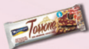
Cód: 1212 Torrone com Amendoim, Cacau e Mel 45g