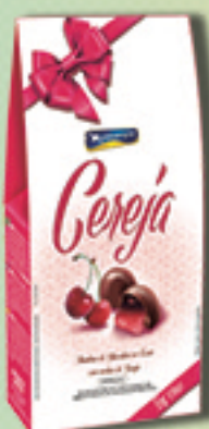
Cód: 2051 Bombom Licor & Cereja Picada