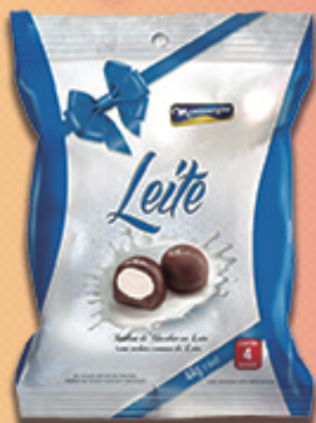
Cód: 2167 Bombom Leite