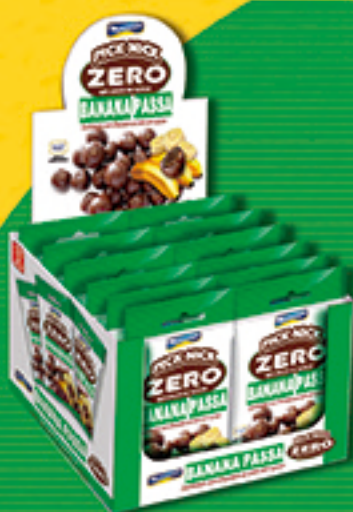
Cód: 3228 Pick Nick Zero Banana Passa