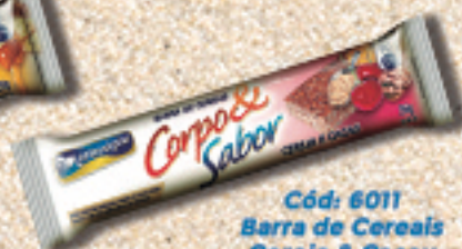
Cód: 6011 Barra de Cereais Cereja & Cacau