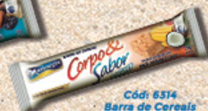
Cód: 6314 Barra de Cereais Salada de Frutas