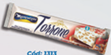
Cód: 1313 Torrone com Castanha de Caju 90g