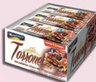
Cód: 1238 Torrone com Amendoim, Cacau e Mel 12x45g