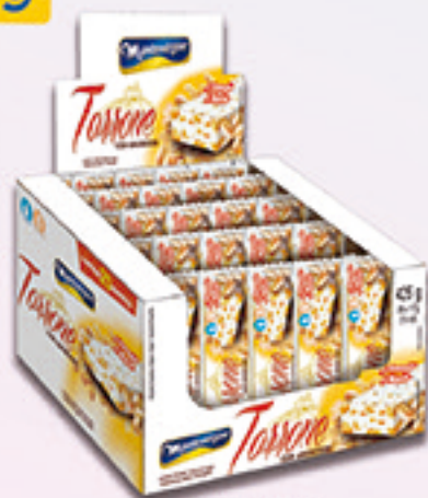
Cód: 1627 Torrone com Amendoim 25x17g