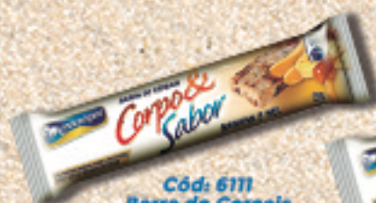
Cód: 6111 Barra de Cereais Banana & Mel