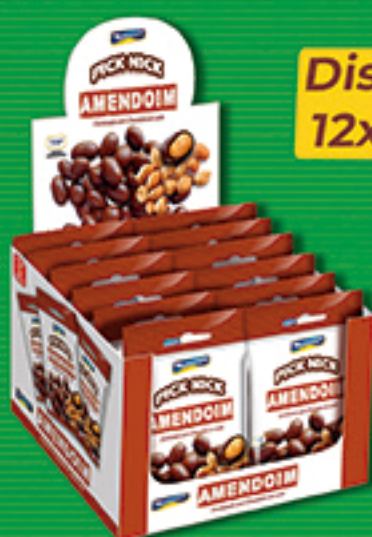
Cód: 3429 Pick Nick Amendoim