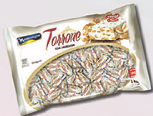
Cód: 1690 Torrone com Amendoim 1kg