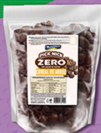
Cód: 3127 Pick Nick Zero Cereal de Arroz