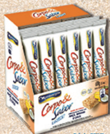
Cód: 6317 Barra de Cereais Salada de Frutas