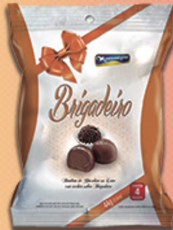
Cód: 2867 Bombom Brigadeiro