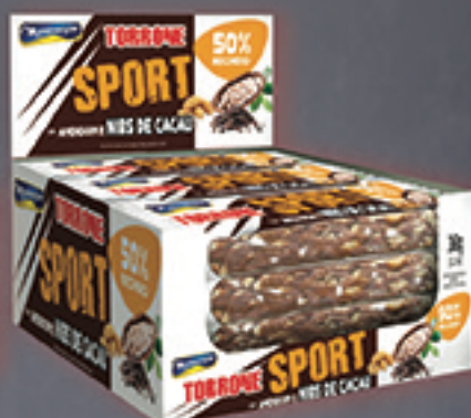
Cód: 1411 Torrone Sport Amendoim & Nibs de Cacau