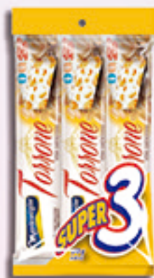
Cód: 1633 Torrone com Amendoim 3x90g