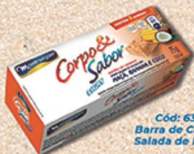
Cód: 6315 Barra de Cereais Salada de Frutas