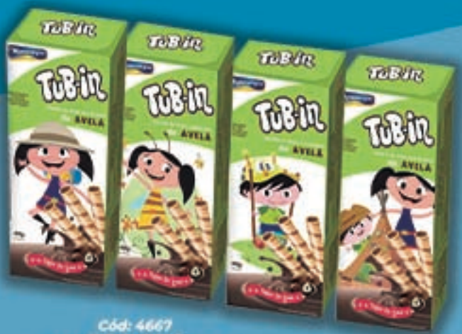
Cód: 4667 Tub-in Avelã "O Show da Luna!" - 48g