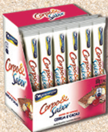
Cód: 6018 Barra de Cereais Cereja e Cacau