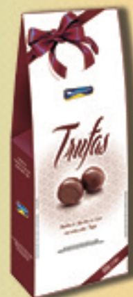
Cód: 2763 Bombom Trufas