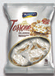
Cód: 1682 Torrone com Amendoim 50g