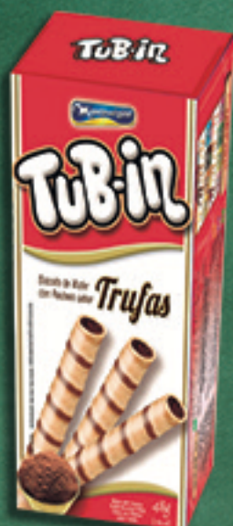
Cód: 4612 TuB-in Trufas - 48g