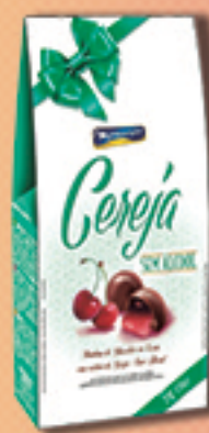
Cód: 2061 Bombom Cereja Picada sem álcool