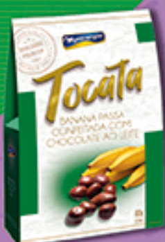
Cód: 3213 Tocata Banana Passa