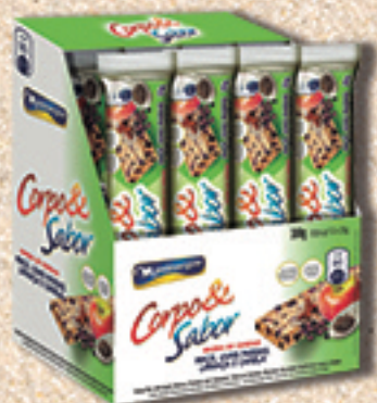
Cód: 6319 Barra de Cereais Maçã & Uvas Passas