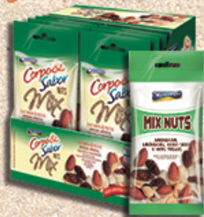
Cód: 6549 Mix Nuts Amendoim, Amêndoas, Coco Seco & Uvas Passas