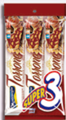
Cód: 1233 Torrone com Amendoim, Cacau e Mel 3x90g