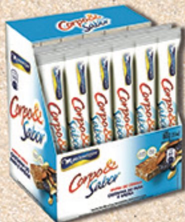
Cód: 6218 Barra de Cereais Castanha do Pará & Ameixa