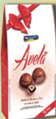
Cód: 2371 Bombom Creme de Avelã