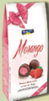
Cód: 2261 Bombom Morango