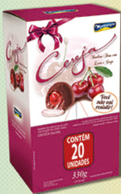
Cód: 2006 Bombom Cereja ao Licor 330g