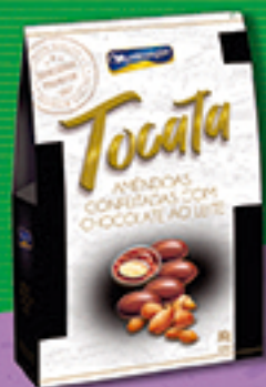
Cód: 2123 Tocata Amêndoas