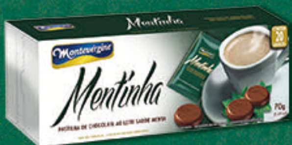
Cód: 2073 Chocolate ao Leite Sabor Menta