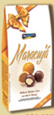
Cód: 2661 Bombom Maracujá