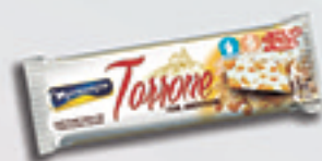
Cód: 1612 Torrone com Amendoim 45g