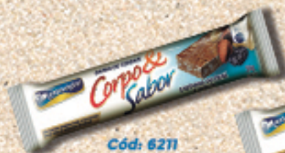
Cód: 6211 Barra de Cereais Castanha do Pará & Ameixa