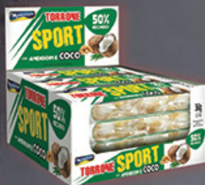
Cód: 1410 Torrone Sport Amendoim & Coco