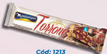
Cód: 1213 Torrone com Amendoim, Cacau e Mel 90g