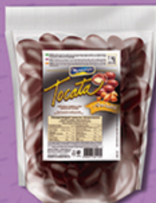
Cód: 2119 Tocata Amêndoas