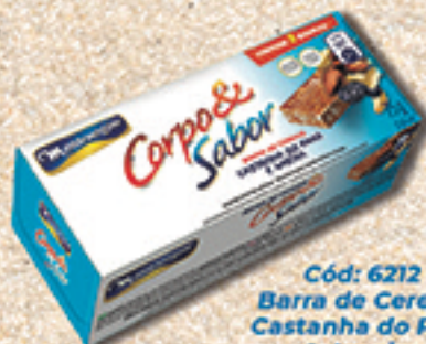
Cód: 6212 Barra de Cereais Castanha do Pará & Ameixa