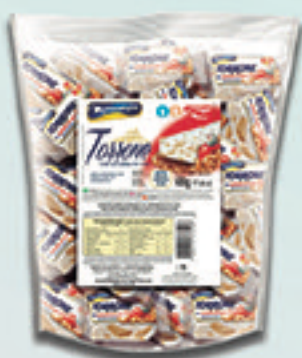
Cód: 1300 Torrone com Castanha de Caju 500g