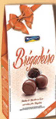
Cód: 2851 Bombom Brigadeiro