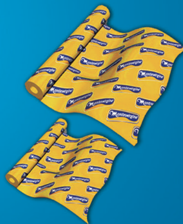
BOBINA DE FORRAÇÃO (LARGURAS: 62cm | 25cm)