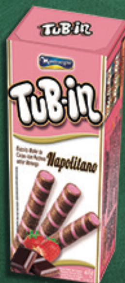
Cód: 4674 TuB-in Napolitano - 48g