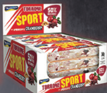
Cód: 1412 Torrone Sport Amendoim & Cranberry