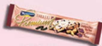
Cód: 1812 Torrone Premium com Castanha do Pará 70g