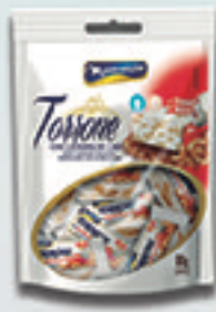
Cód: 1383 Torrone com Castanha de Caju 80g