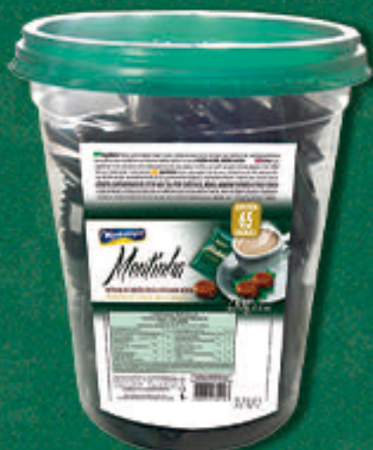
Cód: 2016 Chocolate ao Leite Sabor Menta Pote de 230g