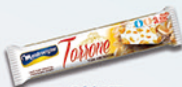
Cód: 1671 Torrone com Amendoim 70g