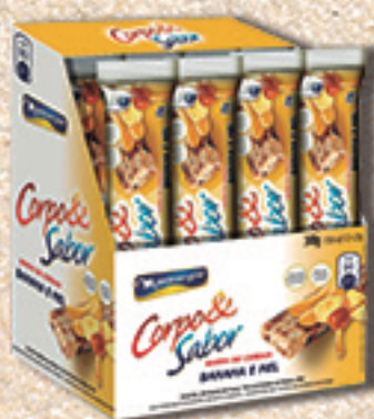
Cód: 6119 Barra de Cereais Banana & Mel