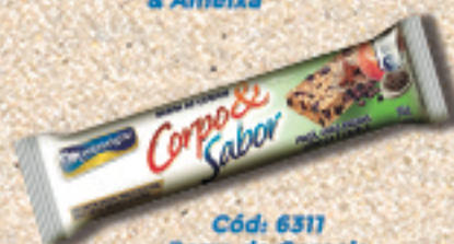
Cód: 6311 Barra de Cereais Maçã & Uvas Passas