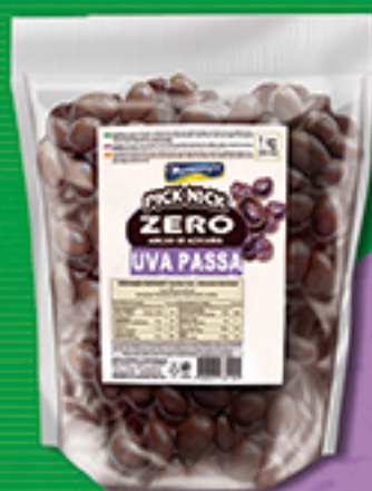
Cód: 3027 Pick Nick Zero Uvas Passas