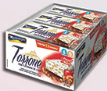
Cód: 1338 Torrone com Castanha de Caju 12x45g