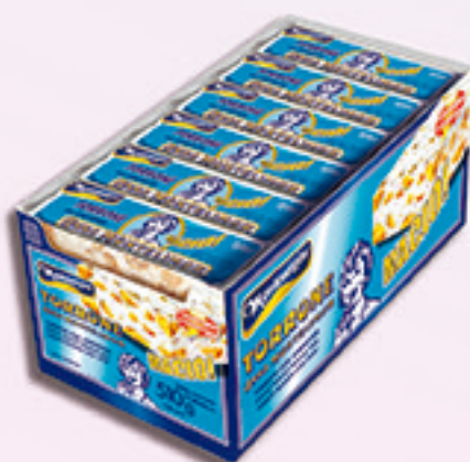
Cód: 1108 Torrone Ana Montelimar com Amendoim 30x17g