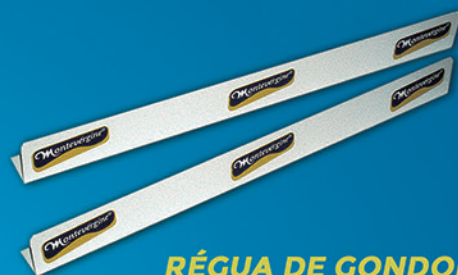
RÉGUA DE GONDOLA (CANTONEIRA)