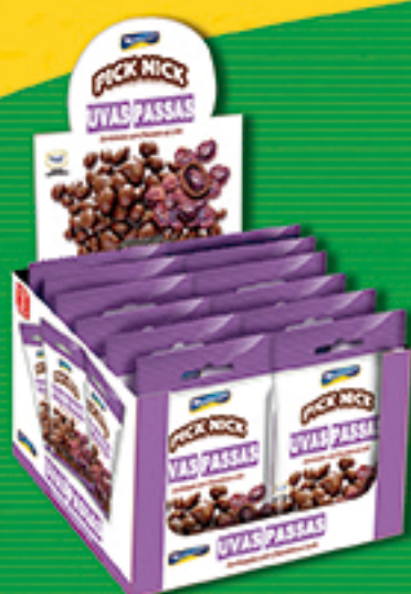
Cód: 3029 Pick Nick Uvas Passas