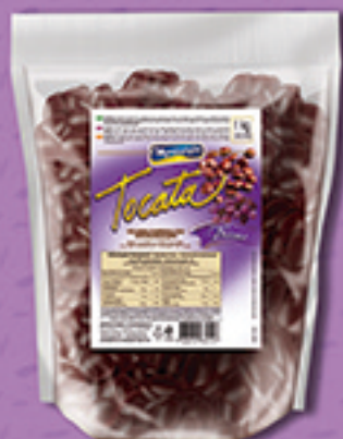
Cód: 3019 Tocata Uvas Passas