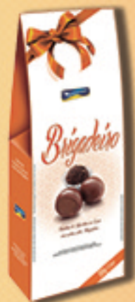
Cód: 2863 Bombom Brigadeiro