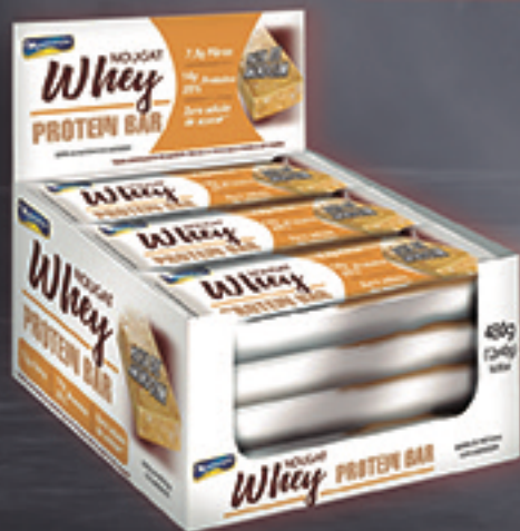
Cód: 5011 MontevérGINE Whey Nougat Protein Bar Pasta de Amendoim