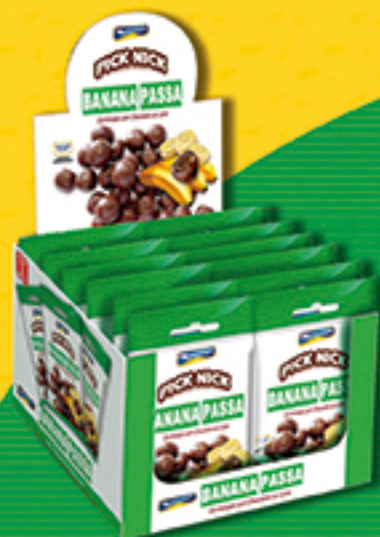
Cód: 3229 Pick Nick Banana Passa