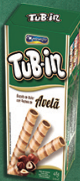
Cód: 4622 TuB-in Avelã - 48g