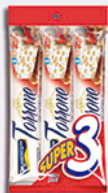
Cód: 1333 Torrone com Castanha de Caju 3x90g