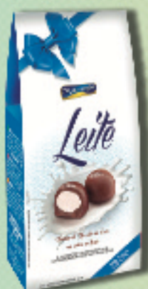
Cód: 2161 Bombom Leite