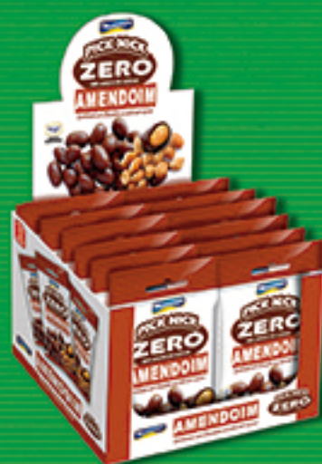
Cód: 3428 Pick Nick Zero Amendoim