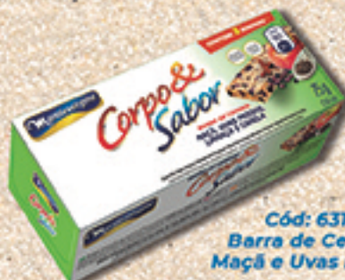
Cód: 6312 Barra de Cereais Maçã e Uvas Passas