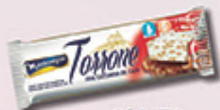
Cód: 1312 Torrone com Castanha de Caju 45g