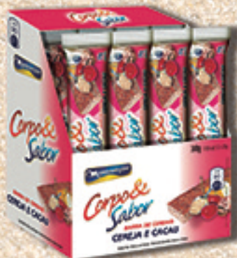
Cód: 6019 Barra de Cereais Cereja & Cacau