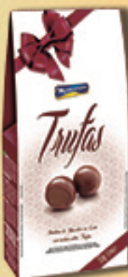
Cód: 2761 Bombom Trufas