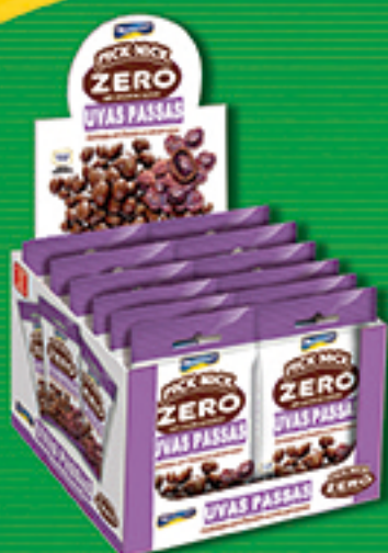
Cód: 3028 Pick Nick Zero Uvas Passas