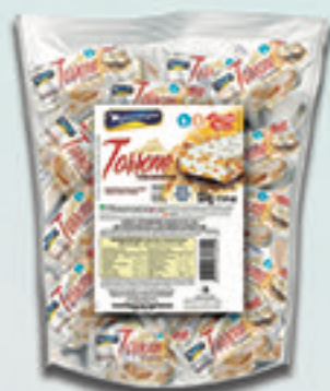
Cód: 1600 Torrone com Amendoim 500g