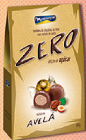
Cód: 2462 Bombom Creme de Avelã Zero Adição de Açúcar 80g