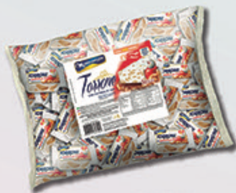
Cód: 1399 Torrone com Castanha de Caju 1kg