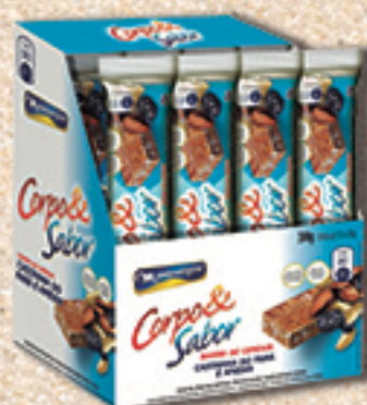
Cód: 6219 Barra de Cereais Castanha do Pará & Ameixa