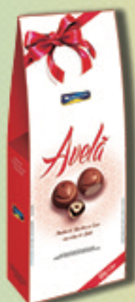
Cód: 2373 Bombom Creme de Avelã