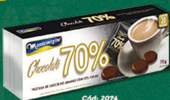
Cód: 2074 Chocolate 70% Cacau