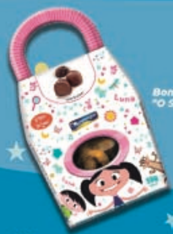
Cód: 7001 Bolsa com Bombons de Brigadeiro "O Show da Luna!" - 55g