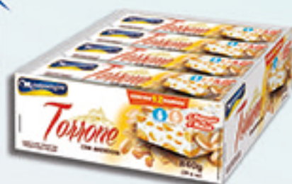
Cód: 1636 Torrone com Amendoim 12x70g