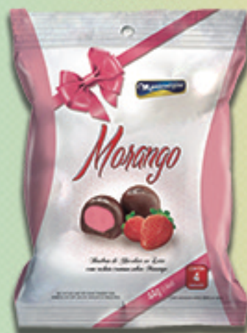
Cód: 2267 Bombom Morango