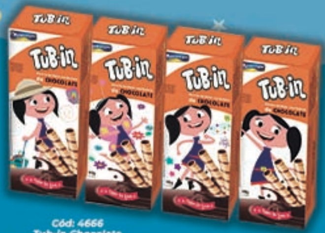
Cód: 4666 Tub-in Chocolate "O Show da Luna!" - 48g