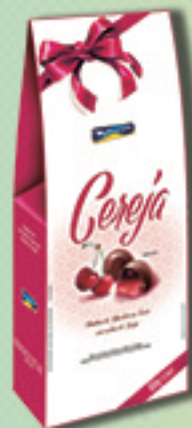
Cód: 2053 Bombom Licor & Cereja Picada