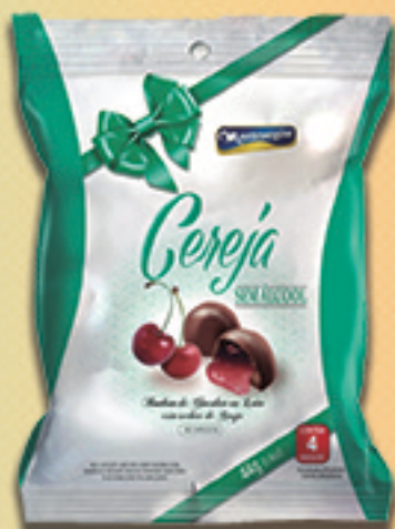
Cód: 2067 Bombom Cereja Picada sem álcool