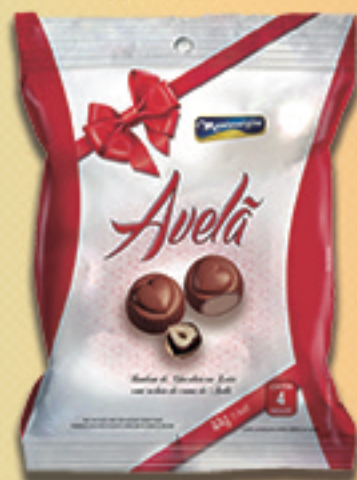
Cód: 2577 Bombom Avelã