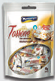
Cód: 1683 Torrone com Amendoim 80g