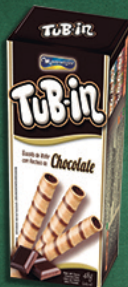
Cód: 4652 TuB-in Chocolate - 48g

A HORA DO RECREIO NUNCA FOI TÃO GOSTOSA !!