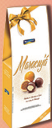
Cód: 2663 Bombom Maracujá