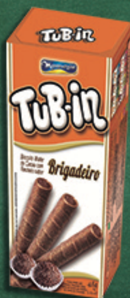
Cód: 4647 TuB-in Brigadeiro - 48g