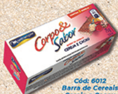
Cód: 6012 Barra de Cereais Cereja e Cacau