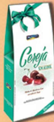
Cód: 2063 Bombom Cereja Picada sem álcool