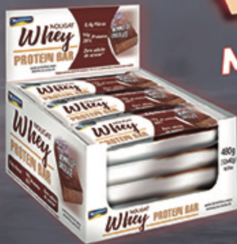
Cód: 5012 MontevérGINE Whey Nougat Protein Bar Brownie de Chocolate