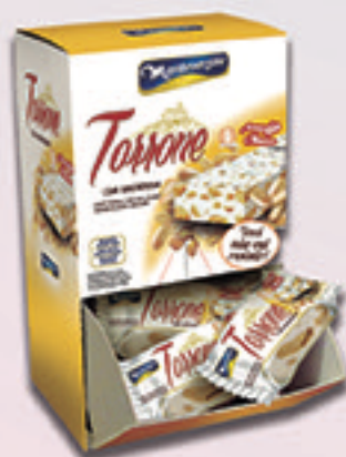
Cód: 1686 Torrone com Amendoim 300g