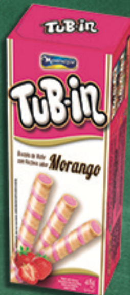
Cód: 4673 TuB-in Morango - 48g