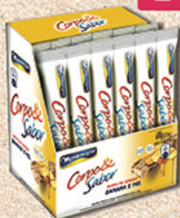
Cód: 6118 Barra de Cereais Banana e Mel