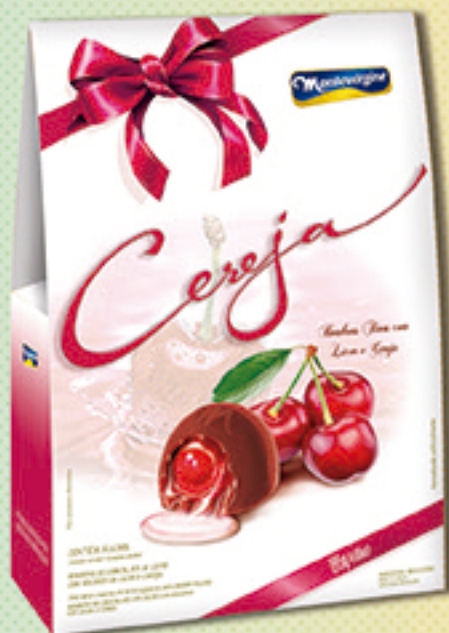
Cód: 2005 Bombom Cereja ao Licor 195g