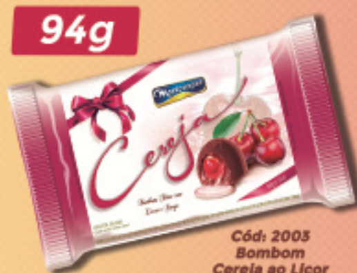
Cód: 2003 Bombom Cereja ao Licor