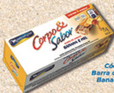
Cód: 6112 Barra de Cereais Banana e Mel