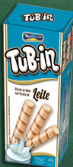
Cód: 4632 TuB-in Leite - 48g