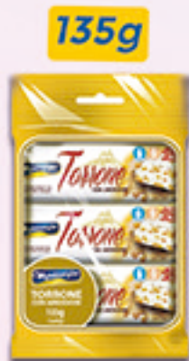
Cód: 1632 Torrone com Amendoim 24x135g