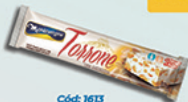
Cód: 1613 Torrone com Amendoim 90g