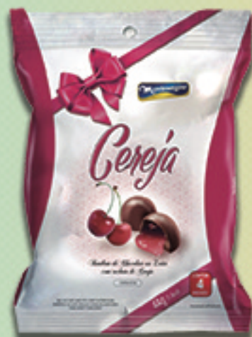
Cód: 2057 Bombom Licor & Cereja Picada