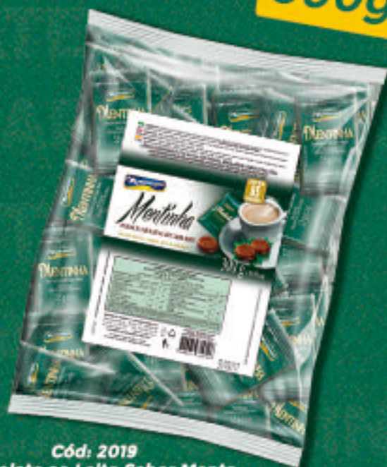
Cód: 2019 Chocolate ao Leite Sabor Menta Pacote de 300g - Aprox. 85 unid