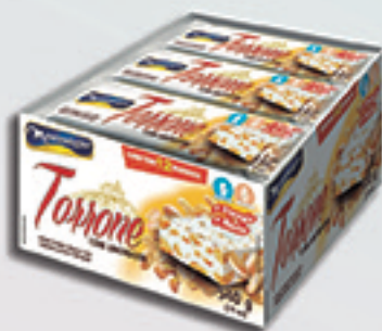
Cód: 1638 Torrone com Amendoim 12x45g