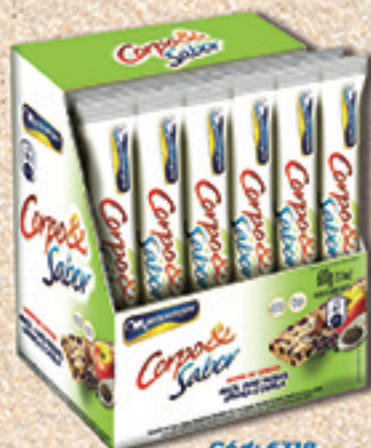
Cód: 6318 Barra de Cereais Maçã e Uvas Passas