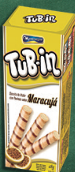
Cód: 4692 TuB-in Maracujá - 48g