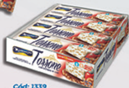
Cód: 1339 Torrone com Castanha de Caju 12x90g