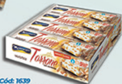
Cód: 1639 Torrone com Amendoim 12x90g