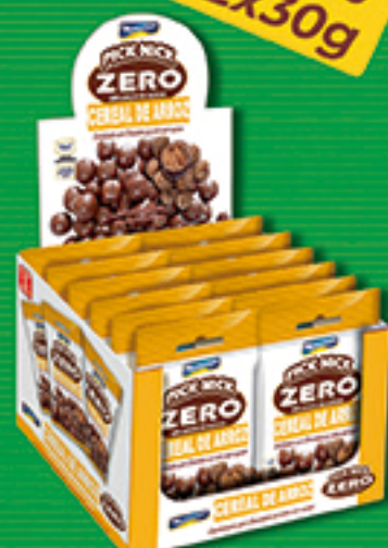
Cód: 3128 Pick Nick Zero Cereal de Arroz