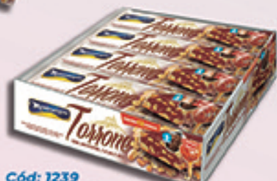
Cód: 1239 Torrone com Amendoim, Cacau e Mel 12x90g