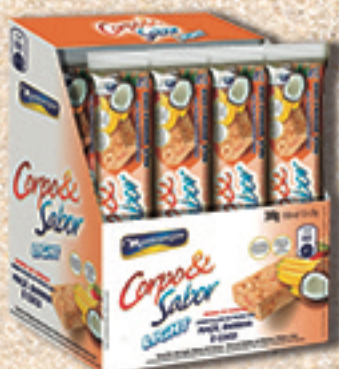
Cód: 6316 Barra de Cereais Salada de Frutas