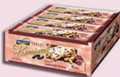
Cód: 1836 Torrone Premium com Castanha do Pará 12x70g